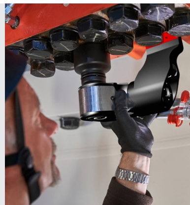
alkitronic® AT Einsatz in einer Windkraftanlage